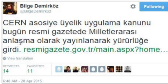
Şekil 4. Örnek 2'de gösterilen künyenin Tweet paylaşımı