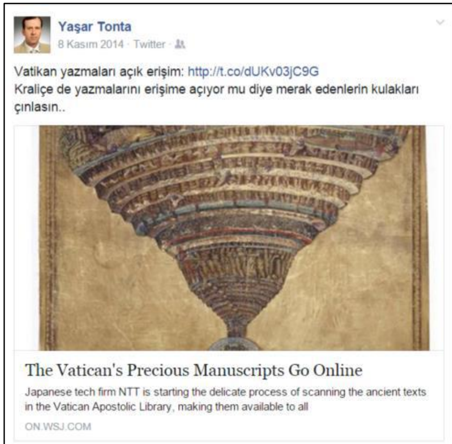
Şekil 1. Örnek 1'de gösterilen künyenin Facebook paylaşımı