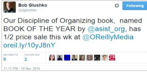
Şekil 3. Örnek 1'de gösterilen künyenin Tweet paylaşımı