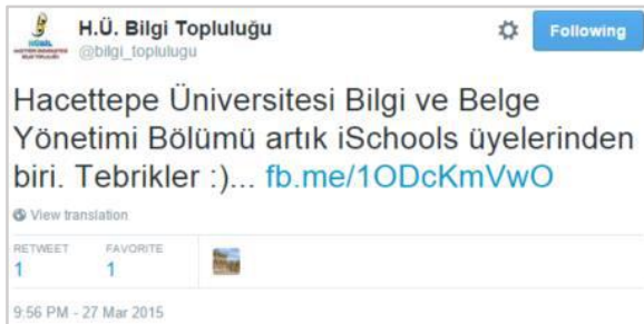
Şekil 5. Örnek 3'te gösterilen künyenin Tweet paylaşımı