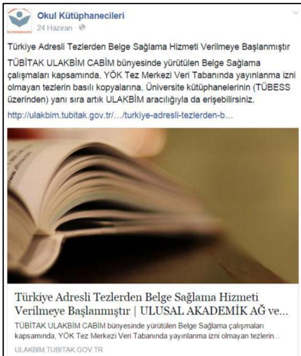
Şekil 2. Örnek 2'de gösterilen künyenin Facebook paylaşımı

Not: Facebook üzerinden paylaşılan video, fotoğraf ya da infografikler için yapılan tek değişiklik köşeli parantez içerisindeki açıklamanın paylaşımın türüne göre [Video], [Fotoğraf], [Infografik] şeklinde değiştirilmesidir.